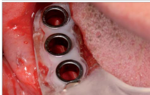
Schablone außerhalb und innerhalb des Mundes.