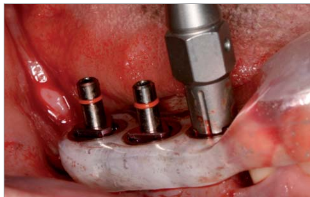
Klinische Situation bei eingesetzter Schiene und bereits inserierten Implantaten. Deutlich sichtbar die Einbringpfosten der hinteren beiden Implantate und der Ratschenschlüssel auf dem Einbringpfosten des vorderen Implantats.